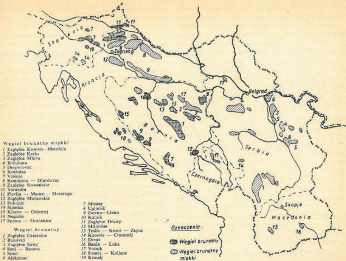
Rys. 1. Rozmieszczenie zagłębi węgla brunatnego w Jugosławii

do Włoch) przypadają 400 tys. t, na twarde węgiel brunatny 4,1 mln t i na miękki brunatny 1,1 mln t. W następnym dziesięcioleciu, tj. do 1939 r., wydobycie twardego węgla brunatnego wzrosło zaledwie o 0,2 mln t i o tyle samo wzrosło wydobycie miękkiego węgla brunatnego. Średni roczny przyrost wydobycia twardego węgla brunatnego wynosił zatem około 20 tys., czyli 0,5%, natomiast średni roczny przyrost wydobycia miękkiego węgla brunatnego, kształtujący się również w granicach 20 tys. t, przy 4-krotnie niższym wydobyciu w porównaniu z twardym węglem brunatnym wynosił 2%. Wydobycie węgla nie pokrywało w pełni zapotrzebowania kraju wówczas bardzo słabo uprzemysłowionego. W okresie tym brak było zainteresowania rozwojem przemysłu górniczego, a także rozbudową starych czy budową nowych kopalń. Całkowite wydobycie węgla pochodziło prawie wyłącznie z kopalń podziemnych.