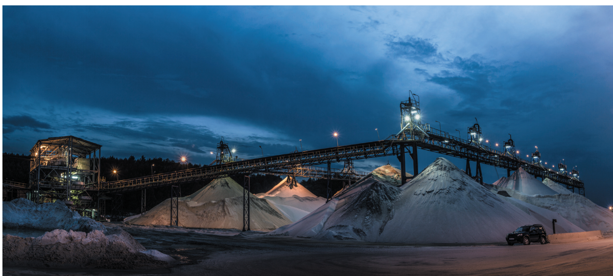
Kopalnia Biała Góra