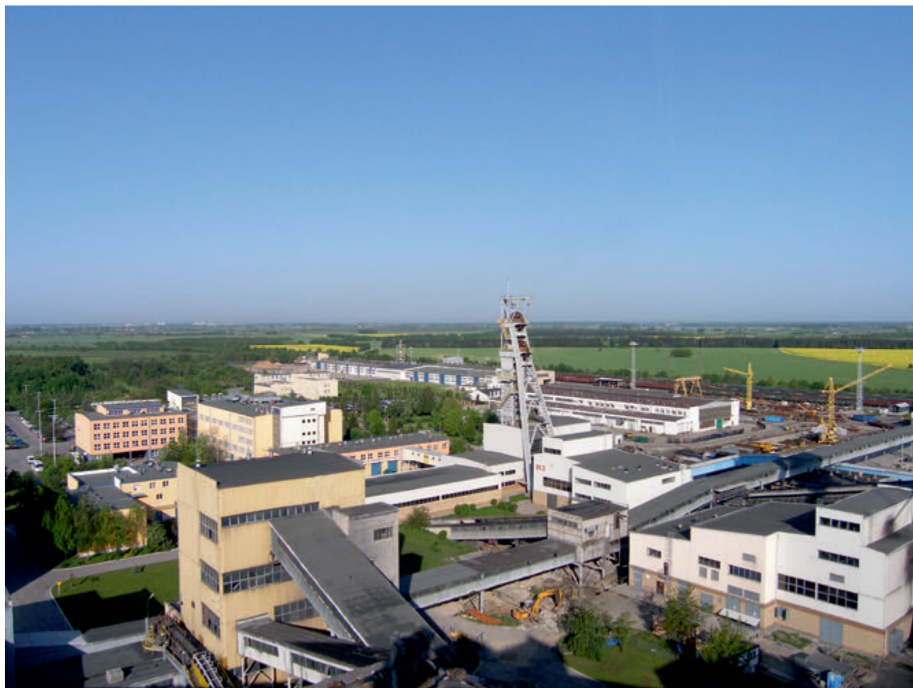
Lubelski Węgiel „Bogdanka” S.A. – widok ogólny z lotu