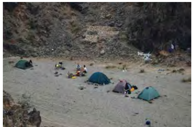
Fot. 5. Obóz terenowy geologów AGH, Bajanchongor, Mongolia (2010 r.)