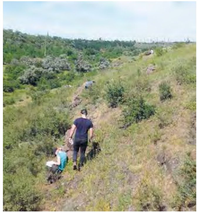
Fot. 3. Profilowanie wychodni BIF z oceną jakości rudy żelaza, praktyka złożowa, Krzywy Róg, Ukraina (2019 r.)

Od lat pracownicy Pracowni Geologii Złóż Rud rozwijają współpracę z krajowymi np.: KGHM PM S.A., ZGH Bolesław, ReALLOYS i międzynarodowymi podmiotami gospodarczymi polegającą na prowadzeniu projektów poszukiwań w różnych krajach np.: Laos, Australia, Peru, Papua, Indonezja, Ukraina, Kosowo, Polska oraz przygotowania raportów zgodnie ze standardami międzynarodowymi (np.: w systemie JORC we współpracy z firmą GEOEXPERT). Pracownicy prowadzą dalsze badania nad rozpoznaniem złóż rud miedzi i srebra na monoklinie przedsudeckiej, niecki północno-sudeckiej, złóż typu MVT, porfirowych i hydrotermalnych, krajowych i zagranicznych, na Bałkanach, w Wietnamie, Kanadzie, Ameryce Południowej oraz metalonośnych konkrecji oceanicznych. Rozwijają się praktyki złożowe na Ukrainie (Fot.1, 2, 3) w ostatnich latach z różną intensywnością związana z wojną a wcześniej pandemią. W latach 2007-2014, pracownicy wraz z grupami studenckimi rozpoznawali potencjał złożowy obszaru Bajanchongor w Mongolii (Fot. 4, 5). Były to praktyki finansowane przez Rektora AGH i prywatnego sponsora mongolskiego. Co najważniejsze pracownicy utrzymują kontakty z pracującymi absolwentami, co przynosi wiele pozytywnych aktywności i merytorycznej współpracy.