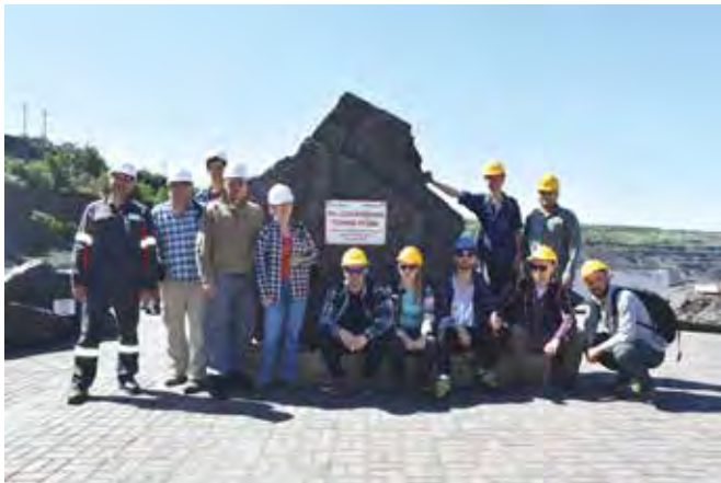
Fot. 1. Grupa studentów GZiG w odkrywcze Pierwomajsk, Krzywy Róg, Ukraina, (2019 r.)