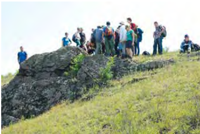
Fot. 2. Wychodnie ubogich rud żelaza typu BIF Krzywy Róg, Ukraina. (2019 r.)