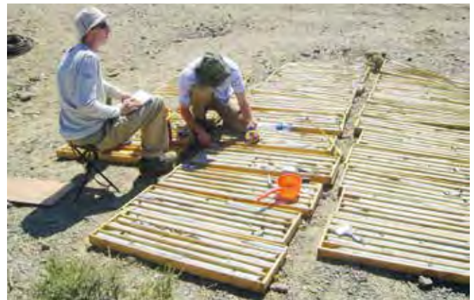
Fot. 4. Studenci GZiG przy opisie rdzeni wiertniczych na koncesji poszukiwawczej, Bajanchongor, Mongolia (2011 r.)